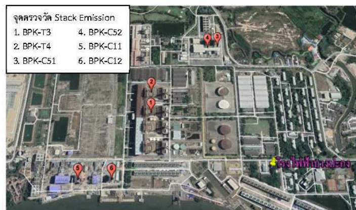
รูปที่ ง-3 แผนที่จุดตรวจวัดคุณภาพอากาศจากปล่องระบาย

โดยปัจจุบัน โรงไฟฟ้าบางปะกง มีการตรวจวัดทั้งหมด 6 ปล่อง ได้แก่ ปล่องโรงไฟฟ้า ปล่องระบายของโรงไฟฟ้าพลังความร้อนบางปะกง เครื่องที่ 3 (BPK-T3) ปล่องระบายของโรงไฟฟ้าพลังความร้อนบางปะกง เครื่องที่ 4 (BPK-T4) ปล่องระบายของโรงไฟฟ้าพลังความร้อนร่วมบางปะกง ชุดที่ 1 (BPK-C11, BPK-C12) และปล่องระบายของโรงไฟฟ้าพลังความร้อนร่วมบางปะกง ชุดที่ 5 (BPK-C51, BPK-C52) ดังแสดงในรูปที่ ง-3