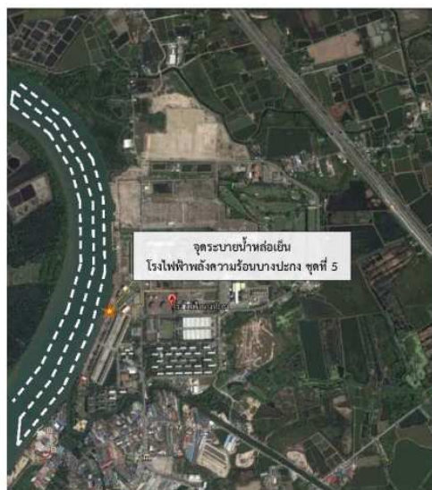
รูปที่ ง-5 แผนที่เส้นทางการตรวจวัดการแพร่กระจายอุณหภูมิน้ำหล่อเย็นในแม่น้ำบางปะกง

ตรวจวัดการแพร่กระจายอุณหภูมิน้ำหล่อเย็นในแม่น้ำบางปะกงจากจุดปล่อยน้ำหล่อเย็นของโรงไฟฟ้า โดยใช้เครื่องมือตรวจสอบค่าพิกัด GPS (Global Position System) เครื่องวัดอุณหภูมิแสดงผลเป็นตัวเลข 1 เครื่อง เครื่องมือวัดความลึก (Sonar) 1 เครื่อง และเรือ 1 ลำ ข้อมูลที่ได้จากการตรวจวัดแต่ละจุด คือ ค่าอุณหภูมิน้ำตามระดับความลึกเป็นองศาเซลเซียสที่วัดได้จากเครื่องวัดอุณหภูมิต่ำความลึกเป็นเมตรจากเครื่องวัดความลึก ที่ติดตั้งอยู่บนเรือ และค่าพิกัดที่วัดได้จากเครื่อง GPS นำข้อมูลที่ได้ไปประมวลผลด้วยเครื่องคอมพิวเตอร์โดยใช้โปรแกรม Surfur® และผลที่ได้จากการวิเคราะห์จะแสดงในรูปแบบของแผนที่แสดงการแพร่กระจายอุณหภูมิน้ำหล่อเย็นในแม่น้ำบางปะกง สำหรับแผนที่จุดตรวจวัด แสดงดังรูปที่ ง-5