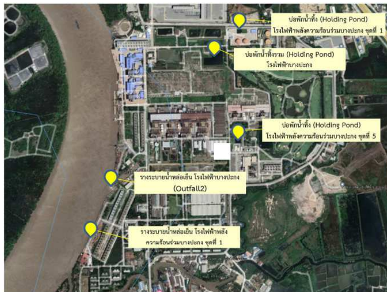
รูปที่ ง-6 จุดตรวจวัดคุณภาพน้ำทิ้งของโรงไฟฟ้าบางปะกง