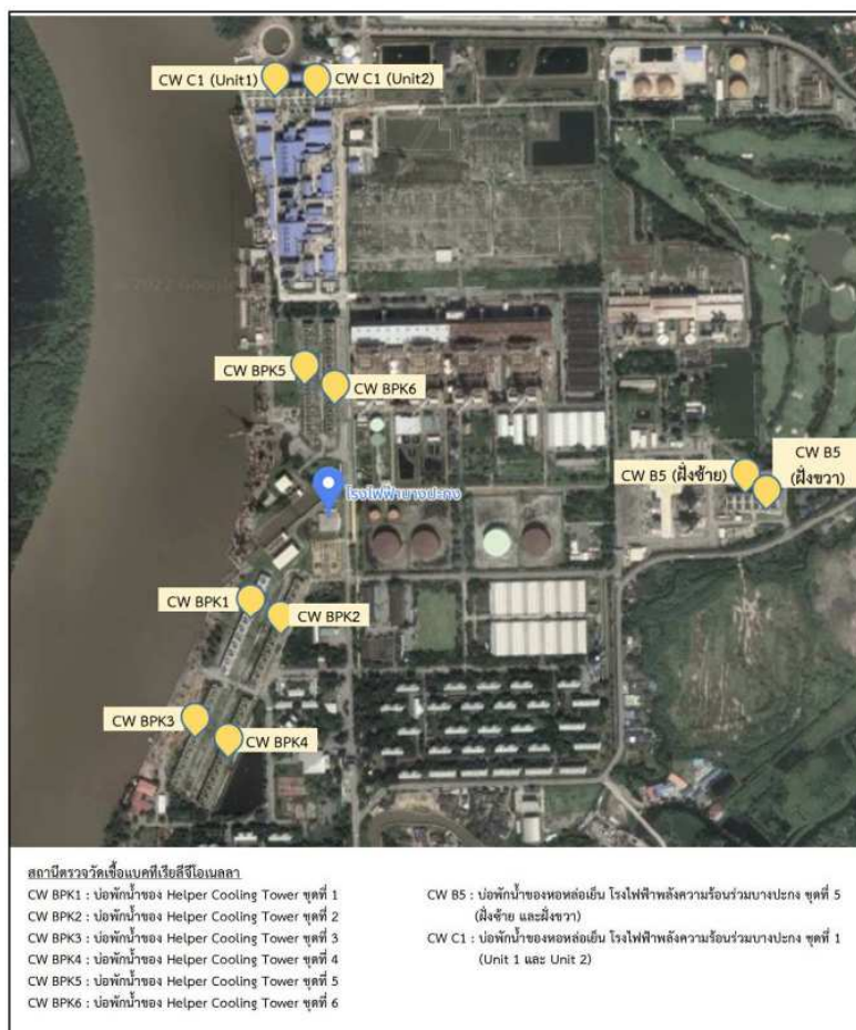
รูปที่ ง-7 จุดตรวจวัดเชื้อ Legionella sp. จากบ่อพักน้ำของหอหล่อเย็น