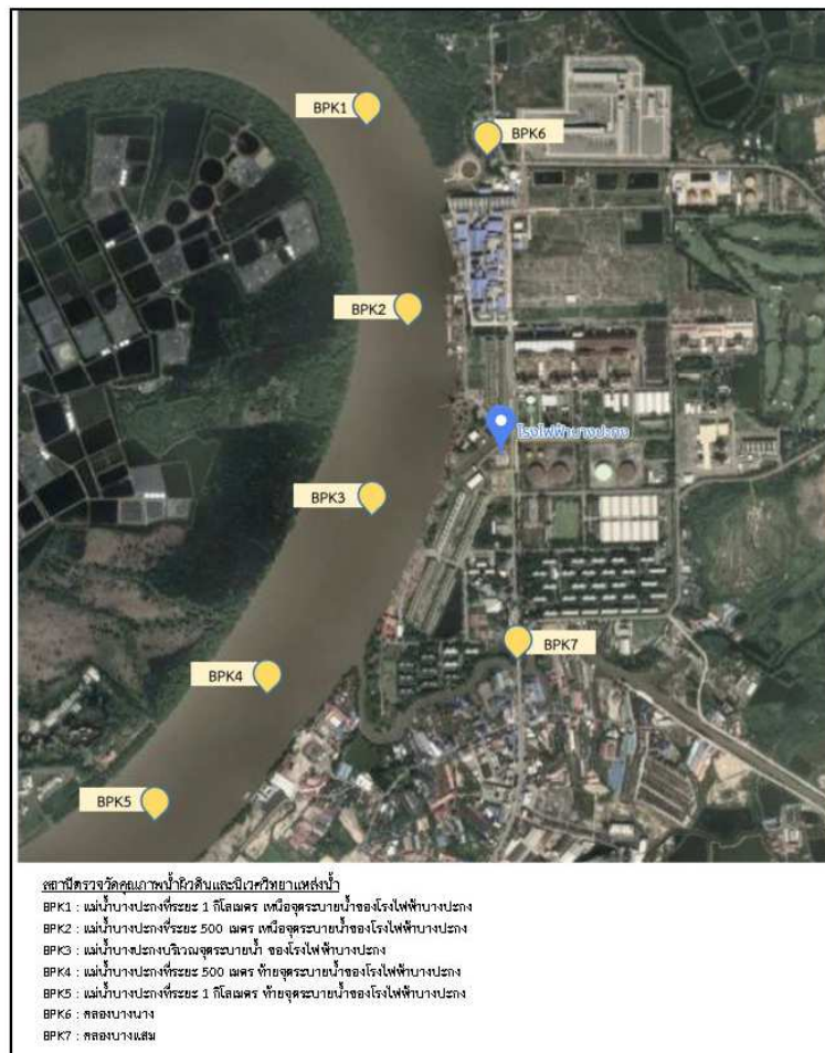
รูปที่ ง-4 จุดตรวจวัดคุณภาพน้ำผิวดินและนิเวศวิทยาแหล่งน้ำของโรงไฟฟ้าบางปะกง

ตรวจวัดคุณภาพน้ำผิวดินของโรงไฟฟ้าบางปะกงทุก 4 เดือน โดยตรวจวัดคุณภาพน้ำผิวดินในแม่น้ำบางปะกง จำนวน 5 สถานี คลองบางนาง 1 สถานี และคลองบางแสม 1 สถานี รวม 7 สถานี และตรวจวัดดัชนีไทรอาโลมีเทน สารกำจัดแมลง (Pesticides) และสารกำจัดวัชพืช (Herbicides) จำนวน 3 สถานี ในแม่น้ำบางปะกง โดยไทรอาโลมีเทน ตรวจวัดทุก 4 เดือน สำหรับ สารกำจัดแมลง (Pesticides) และสารกำจัดวัชพืช (Herbicides) ตรวจวัดปีละ 2 ครั้ง ในช่วงฤดูแล้ง และฤดูฝน (สถานีตรวจวัดดังรูปที่ ง-4)